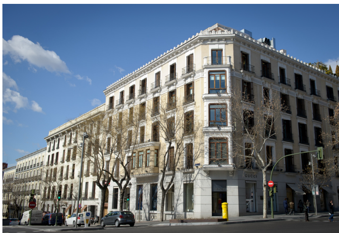
Seu de Banco Alcalá (Madrid)

Posteriorment, la compra de Banco Alcalá (amb seu social a Madrid i una oficina a Barcelona) ha introduït el Grup en el mercat de banca privada espanyol, on es presten serveis de gestió global de patrimonis per a clients privats i institucionals. Aquestes dues operacions han permès al Grup consolidar la presència en el mercat europeu.